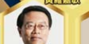
國際談判權威 劉少榮博士