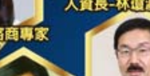
中華開發金控 資深副總 張立荃